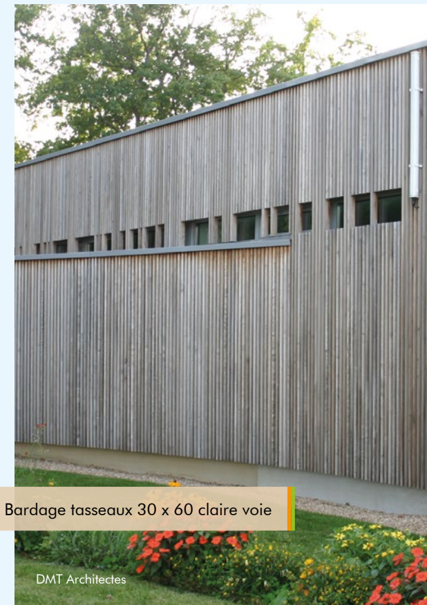
Bardage tasseaux 30 x 60 claire voie