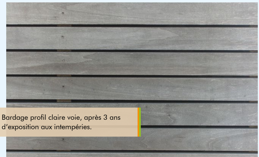
Bardage profil claire voie, après 3 ans d'exposition aux intempéries.